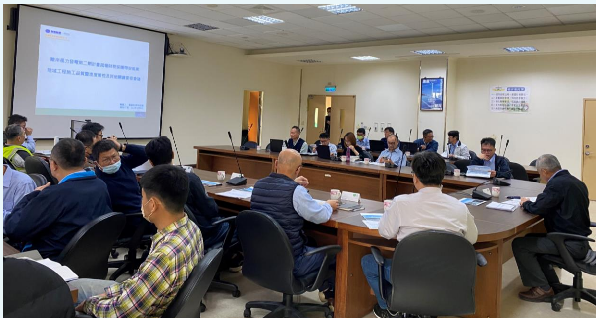
與會廠商代表進行意見交流