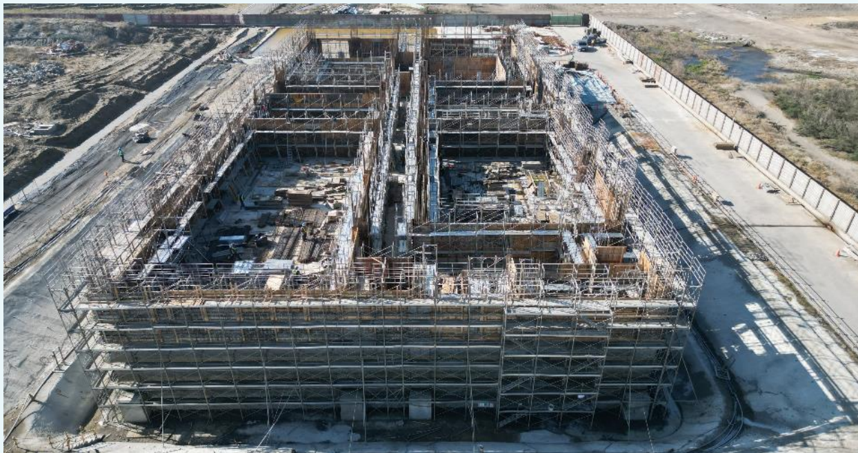
陸上電氣室施工空拍圖