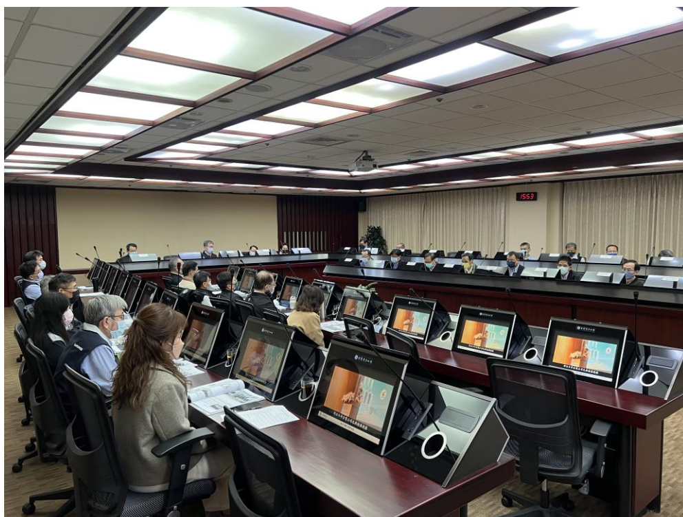
Fig. 2 政風處廉政工作重點執行概況報告