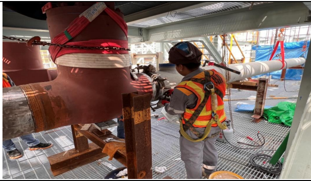
主發電設備工程 Unit 3 MPR 配管