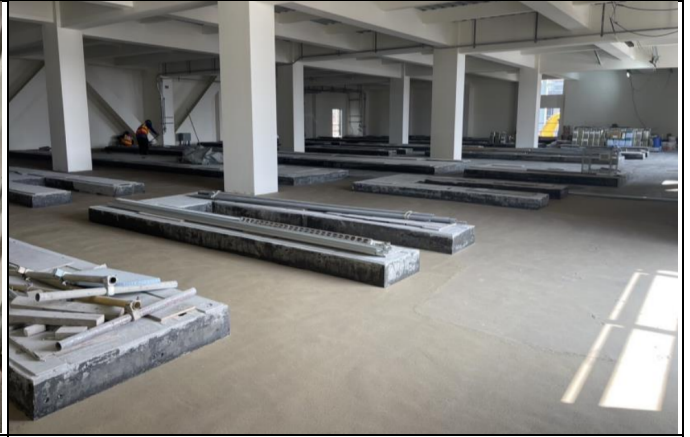
主發電設備工程 Unit 3 GTEB 建築裝修